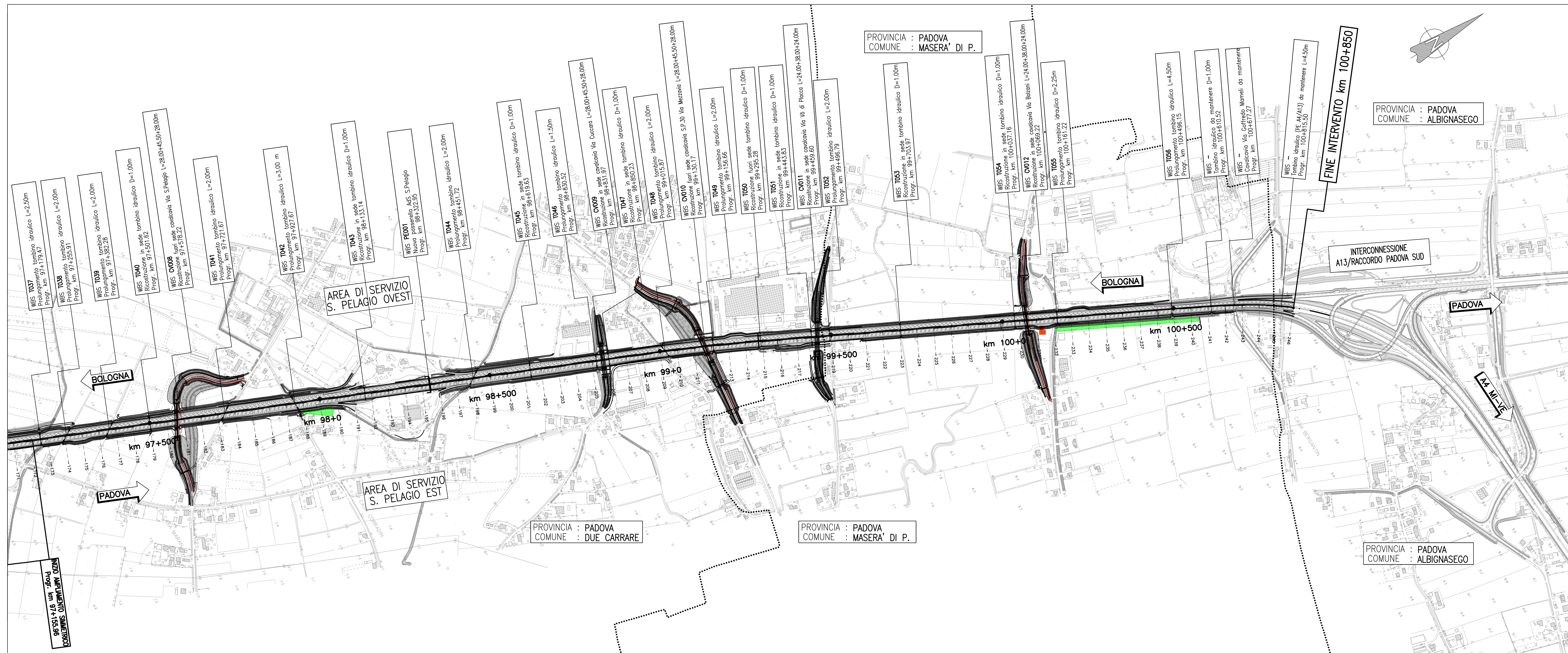
QUADRO 4 - PLANIMETRIA DI PROGETTO dal km 97+500 al km 100+850 - 1:5.000